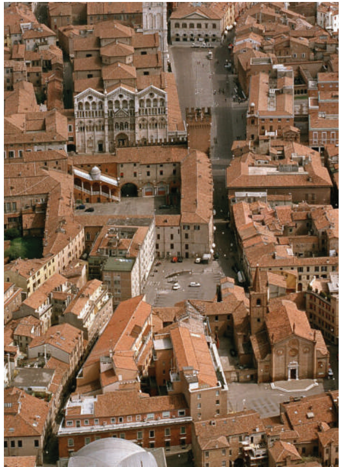
Aerea di Ferrara

Domenica 2 e 23 maggio 2021, alle 10.00, si parte alla scoperta di "Ferrara Città del Novecento", in un affascinante viaggio fra le ville liberty e le imponenti architetture del ventennio fascista.