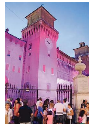
Il castello estense tinto di rosa