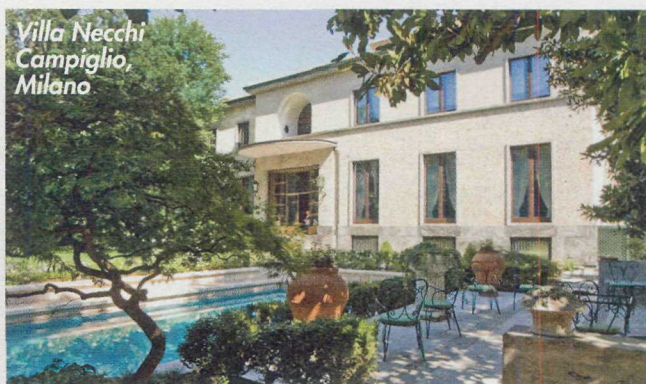
Villa Necchi Campiglio, Milano