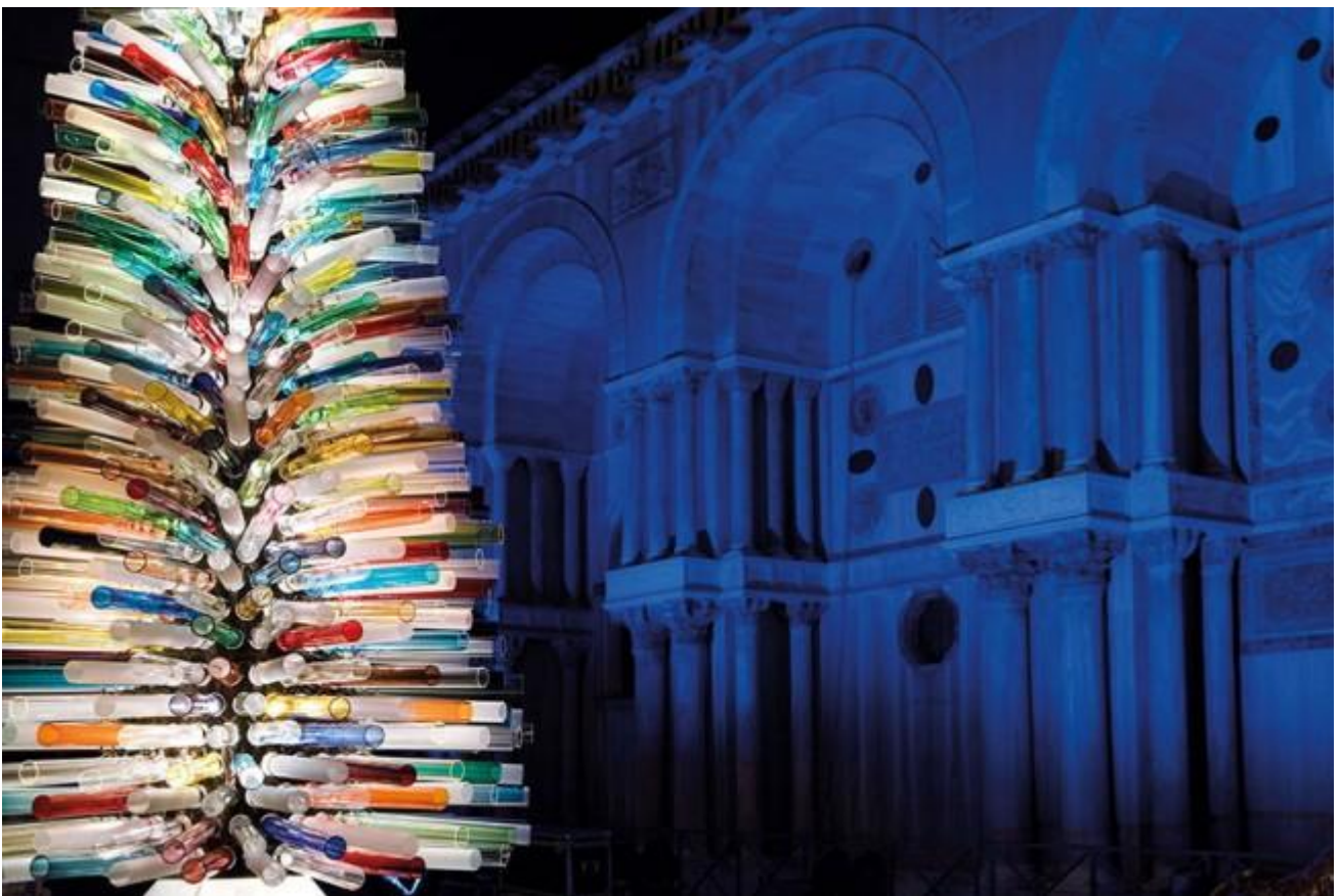
Albero di Natale di vetro a Ferrara