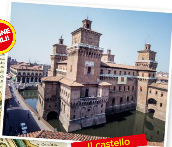
Il castello e la mappa

A sinistra, su una mappa del Seicento di Ferrara i luoghi da visitare; un salto nel tempo per seguire le tracce del poeta e i luoghi più amati. Sopra, il Castello Estense, il monumento più importante della città.