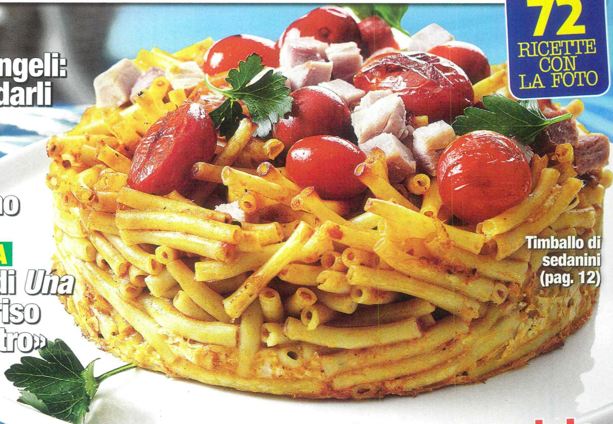
Timbale di sedanini (pag. 12)