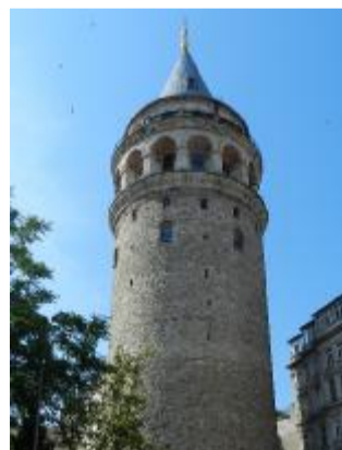
La torre di Galata, a Istanbul

Fuochi d'artificio sul Bosforo per un Capodanno a Istanbul. Il miglior punto per vedere lo spettacolo è intorno alla Torre di Galata, dove l'occhio può spaziare a 360 gradi sulla città. 4Wind (tel. 06 7024406) propone una combinazione di 4 giorni - 3 notti a partire da 269 euro con volo, trasferimenti, hotel e prima colazione. Partenza il 29 dicembre.