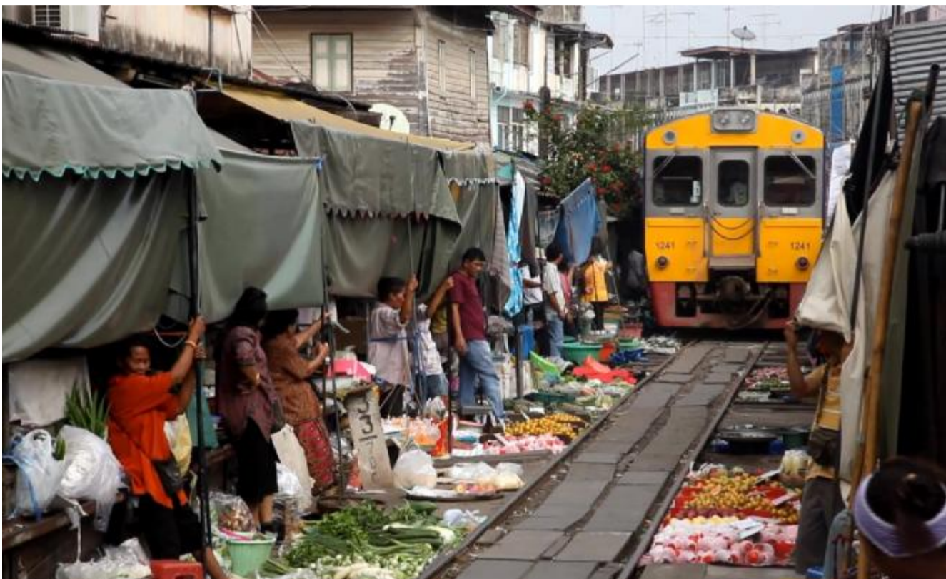
Il curioso e caratteristico MaeKlong Railway Market nella provincia di Samut Songkhram, in Thailandia

I viaggi KiboTours sono prenotabili in agenzia. Informazioni: www.kibotours.com .