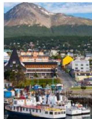
Ushuaia, la fine del mondo

Brindisi di Capodanno alla «fine del mondo», Ushuaia, la città più meridionale al mondo. Il viaggio in Argentina proposto da Tour2000 Americalatina (tel. 071 2803752) prevede tappe a Buenos Aires, Penisola Valdés, Ushuaia, El Calafate, Largo Argentino e ghiacciaio Perito Moreno. Il pacchetto 12 giorni-9 notti costa 3.840 euro, partenza 26 dicembre.