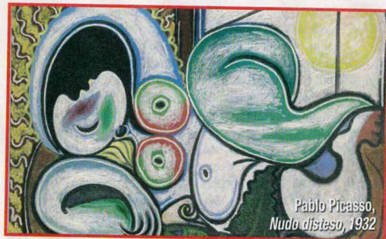
Pablo Picasso, Nudo disteso , 1932

formances in pubblico, i concerti affollati, sono solo alcune delle affinità tra i due, che in tempi diversi e con la stessa straordinaria potenza hanno rivoluzionato la musica. La mostra Paganini rockstar (Genova, Palazzo Ducale, fino al 10 marzo) mette in scena l'artista Paganini, e, come da dietro le quinte di un teatro, ricrea la magia dello spettacolo e rive-